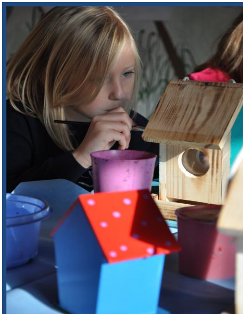
Barvanje ptičjih hišic na jesenovanju volčičev. Kača Kaia

Z molitvijo in polnimi usti kokosovih kroglic, smo naše jesenovanje za letos končali. Kača Kaja